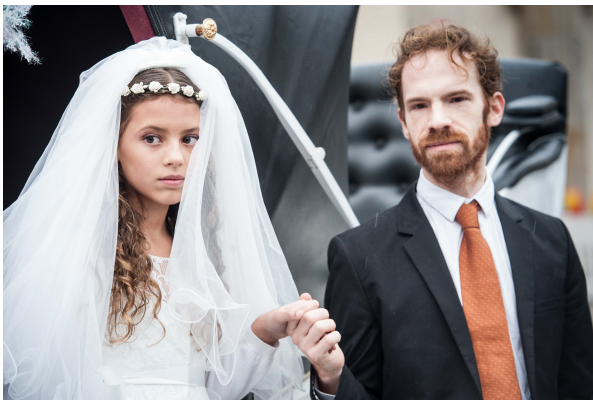
Nachgestellte Verheiratung eines Mädchens

Aber auch wenn die Minderjährige der Eheschließung zugestimmt hat, können Kinder und Jugendliche Folgen und Ausmaß einer verfrühten Eheschließung nicht einschätzen. Folglich können sie sich nicht entsprechend dagegen wehren, das Recht auf Selbstbestimmung und freie PartnerInnenwahl bleibt ihnen somit verwehrt.