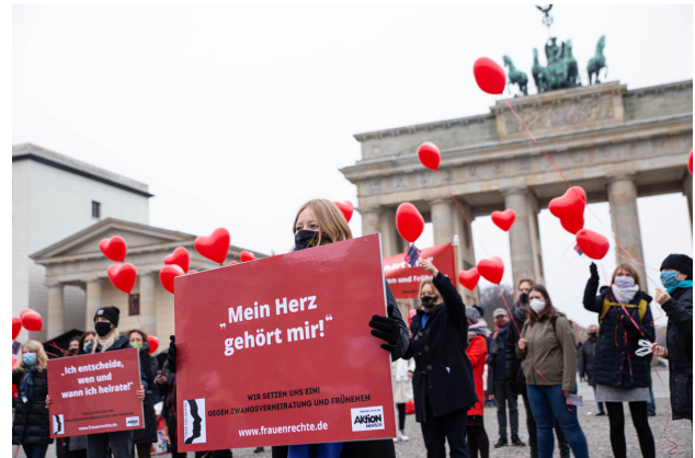
Aktionstag von TERRE DES FEMMES

Die vorgestellten Spiele und Anregungen sollen die Jugendlichen in ihrer Suche nach einem selbstbestimmten Weg stärken und gleichzeitig für kulturelle Unterschiede im Alltag der jungen Menschen sensibilisieren. Entsprechend wurde bewusst vermieden, Klischees zu bedienen, zu stigmatisieren oder zu pauschalisieren.