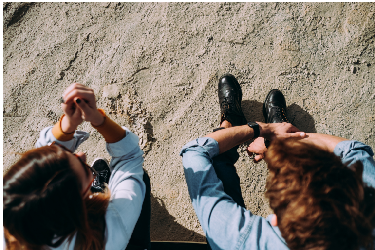
Youth | Foto: Pekic, Getty Images

Diskutieren Sie nach jeder Szene mit der Klasse die verschiedenen Reaktionen und Lösungsvorschläge. Lassen Sie die SchauspielerInnen erzählen, wie sie sich in der jeweiligen Rolle gefühlt haben. Es kann spannend sein, Geschlechterrollen zu tauschen und einen Jungen in die Rolle des Mädchens schlüpfen zu lassen und umgekehrt.