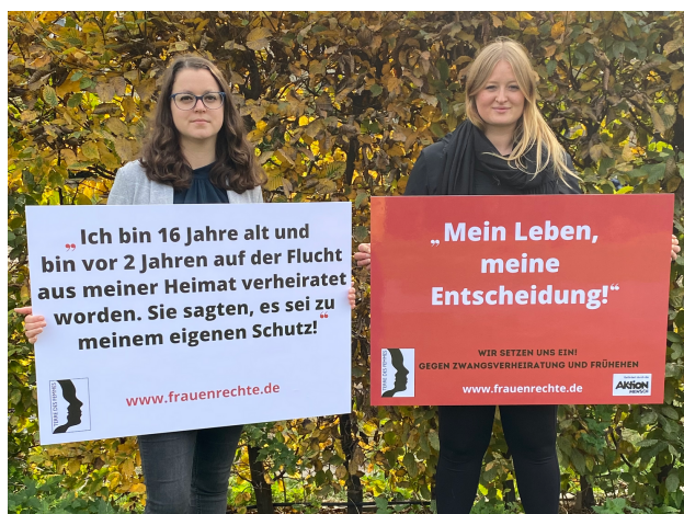
Aktivistinnen gegen Zwangsheirat

Bundesweites Hilfetelefon Männer: Tel: 0800 123 9900 (Mo-Fr)