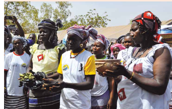
» Öffentliche Zeremonie zur Beendigung von FGM und Vergrabung der Beschneidungswerkzeuge im Dorf Toukin