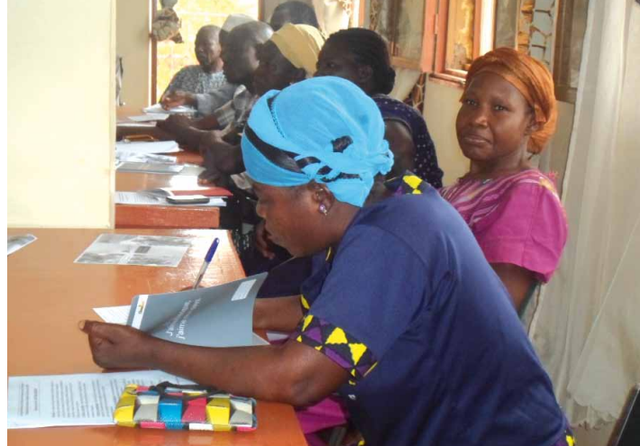
» Schulung in der Anlaufstelle für Gewaltschutz CAECF zu dem seit 2015 in Burkina Faso existierenden Gewaltschutzgesetz

Bitte spenden Sie unter dem Stichwort „Burkina Faso“ auf folgendes Konto: EthikBank IBAN DE35 8309 4495 0103 1160 00 BIC GENODEF1ETK