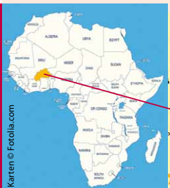
» Sitz von Bangr Nooma in Ouagadougou, Burkina Faso

Burkina Faso gehört zu den ärmsten Ländern der Welt, extreme Armut und Perspektivlosigkeit prägen das Alltagsleben. Gewalt gegen Mädchen und Frauen kommt generell häufig vor. Neben dem Kampf gegen FGM ist deshalb auch der allgemeine Gewaltschutz für Mädchen und Frauen im Zentrum der Kooperation TERRE DES FEMMES – Association Bangr Nooma (ABN) , die seit 1998 besteht.