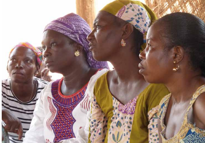
» Frauen bei einem Aufklärungsworkshop zu FGM