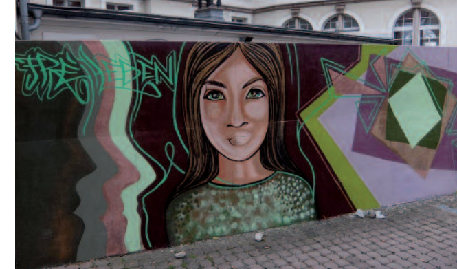
Die TDF Städtegruppe Nürnberg beteiligte sich 2016 mit einer Graffiti-Aktion. Die Rechtecke rechts symbolisieren die Türen, die für alle gewaltbetroffenen Frauen aufgehen sollen. Darauf wurde noch eine weitere Tür aus Plexiglas befestigt, auf die alle Anwesenden schreiben konnten, was für sie eine Tür zum freien Leben bedeutet.

Wir klären auf, wo Traditionen Frauen das Leben schwer machen, protestieren, wenn Rechte beschnitten werden und fordern eine lebenswerte Welt für alle Mädchen und Frauen – gleichberechtigt, selbstbestimmt und frei!