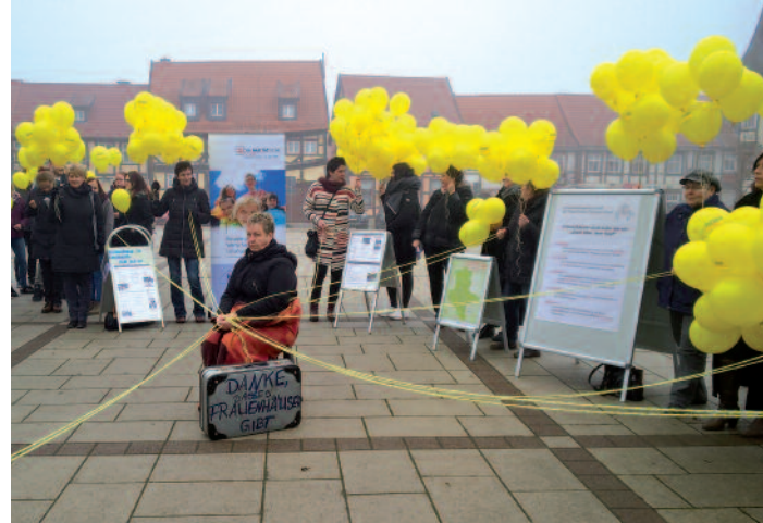
Die Gleichstellungsstelle in Salzwedel inszeniert 2016 eine auffällige Aktion zum Schwerpunktthema Frauenhäuser.