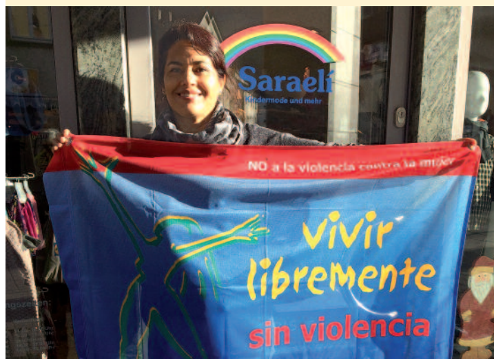
In Schramberg hisste der Frauenbeirat TDF-Fahnen in verschiedenen Sprachen.

Solidarisch demonstrieren Frauen und Männer von Berlin über Honduras bis nach Burkina Faso gegen Gewalt an Mädchen und Frauen. Sie alle zeigen mit ihrem Engagement, dass dieses Thema keine Grenzen kennt und setzen mit der „frei leben – ohne Gewalt“-Fahne ein weithin sichtbares Zeichen.